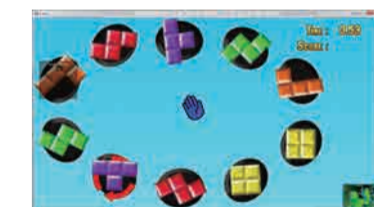
圖6. 新體感腦力鍛鍊-配對遊戲