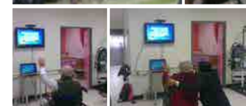
圖9. 阿公阿嬤試玩Kinect體感運動遊戲

所以別以為只有在遊戲設計相關科系才會做遊戲相關設計，現在元智工業工程與管理學系不但能讓你學到如何用遊戲引擎開發體感遊戲，還能讓你深入了解別系無法體會的事務應用。趕快加入元智大學工業工程與管理學系 VR/Exergame 實驗室，讓你/妳未來出路有更多元的選擇，心動不如馬上行動。