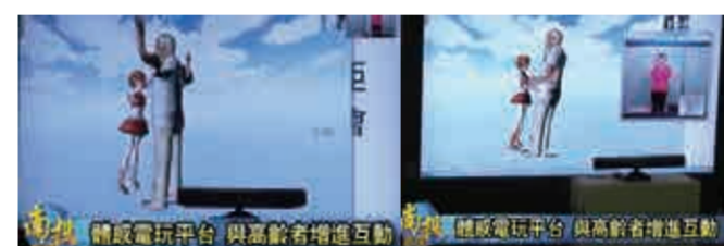
圖2. 遠距Avatar互動技術高齡關懷平台

我們實驗室在2012年擴充了微軟Avatar KinectTM，設計了一款遠距Avatar互動技術的高齡關懷平台，如下圖2所示。旨意是讓照護中心的失智長者與熟識的年輕學生志工能透過此平台一同運動，促進高齡者們的健康。在台灣鄉村地方的失智高齡者普遍還是與子女一同居住，子女卻受到社會生活與工作型態無法常伴左右。大多子女都會選擇將年邁父母交付給照護中心照顧，透過照護中心無微不至的照顧，子女們才能好好工作，給與年邁父母更好的生活品質。在照護中心的高齡者們除了每天參與課程外，其餘時間幾乎都坐在椅子上看電視。高齡者長期靜態不動會造成心血管疾病，更容易加速身體機能