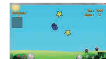
圖7. 抓星星單人遊戲版