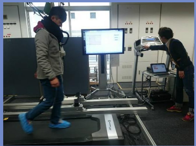
評估行走時跌倒機率等(圖 5)