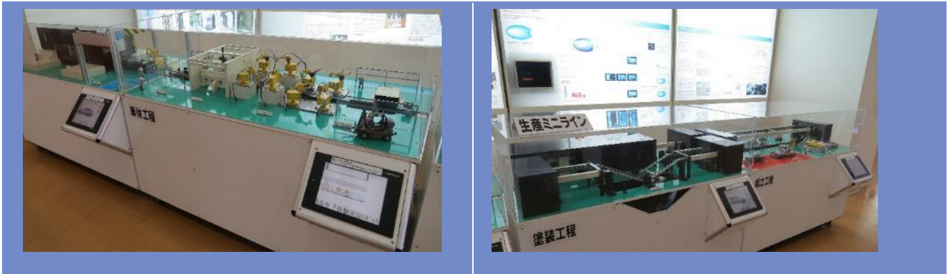
迷你模型汽車製程(圖 3)

其中有項設備，令人稱奇，那就是『無人車』，無人車是利用感測器及預先設定好的程式進行運作，當材料耗盡時，置料台上的感應器會自動通知無人搬運車進行補料，搬運設備零件，而生產線的部分則是一條生產線可以產出五種不同的車款，充分把規格化及標準化做到極致，強調「利用最少資源做最多事」的宗旨。NISSAN 為一個完整體系的工廠，讓人充分了解到公司除了以賺錢為目標外，也要考慮到該工作人員的工作環境與品質，產品才會得到顧客的信賴度。